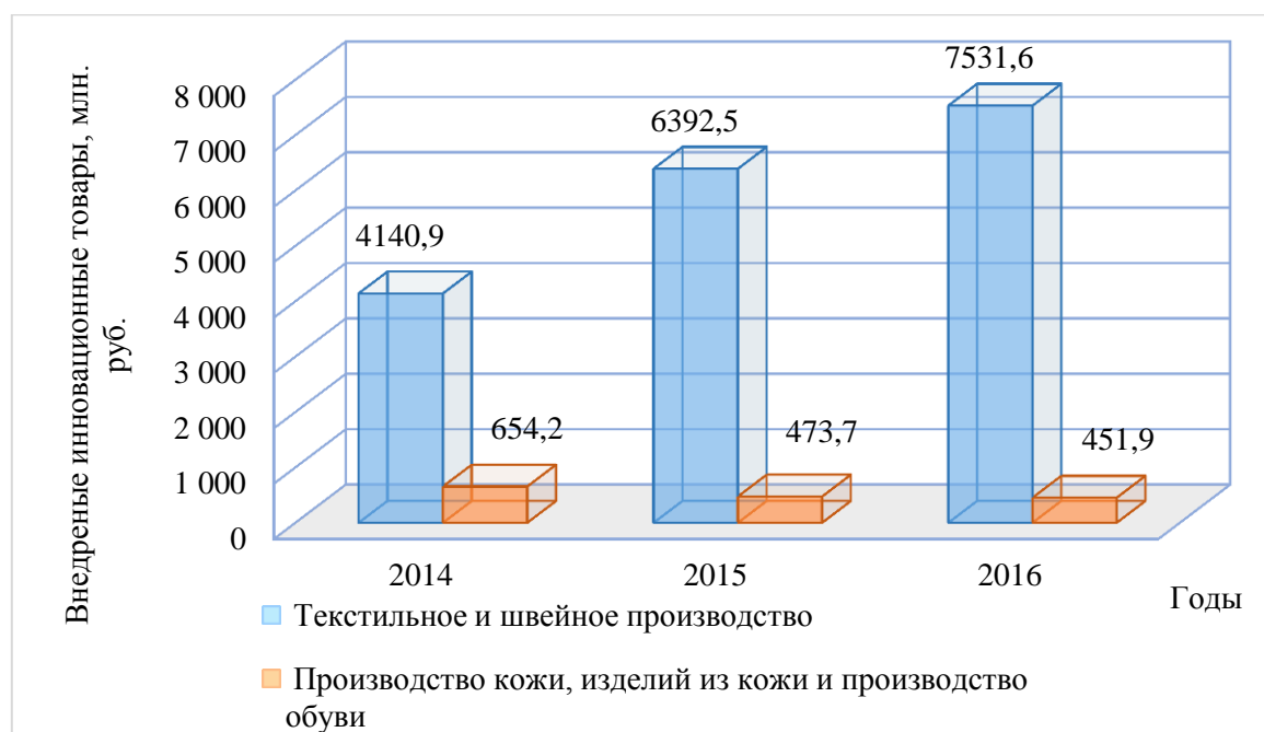
Рисунок 3 – Инновационные товары, работы, услуги, вновь внедренные или подвергавшиеся значительным технологическим изменениям в течение последних трех лет в целом по Российской Федерации по видам экономической деятельности

По официальным данным Федеральной службы государственной статистики РФ в течение трех последних лет в легкомышленном секторе наблюдается увеличение доли инновационных товаров, производимых отечественными предприятиями, в особенности, в области швейного и текстильного производств. В период с 2014 по 2016 гг. объемы внедренных и технологически измененных товаров текстильного и швейного производств в среднем увеличились на 36,01 %, а кожевенного и обувного производства, наоборот, сократились на 16,21% [3]. Описанная тенденция представлена на рисунке 3. Превышение доли инновационных товаров в текстильной промышленности над кожевенным производством обуславливается большими объемами производства, а также повышенным спросом на текстильную продукцию на рынке.